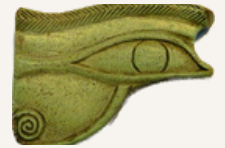
EL OJO DE HORUS

Los artefactos del museo fueron utilizados no sólo como objetos de la colección, sino para los estudios.